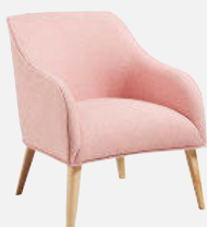
KAVE HOME. Butaca Bobly tapizada con tela Varese y tratamiento antimanchas. Pies en madera. 329 euros.