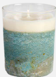
CERABELLA. La firma catalana está especializada en la fabricación de velas orgánicas y artesanales. c.p.v.