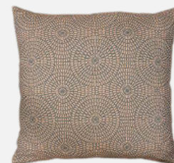
NATUZZI. Su colección incluye cojines minimalistas, de materiales naturales y tonos neutros. c.p.v.