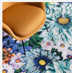
THE RUG COMPANY Mary Katrantzou ha diseñado la alfombra Bluevell Daydrea. A partir de 2.278 euros el m 2 .