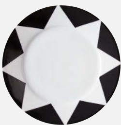
MOLECOT. Una de las vajillas de lujo propuesta se llama Peaks, original y sofisticada. 372 euros (6 platos de postre).